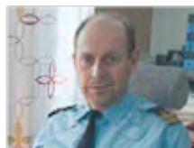
Svåra fall "Om vi ska driva en anmälan till åtal så måste vi tro att vi kan vinna målet."

LUND 41 våldtäktsanmälningar i Lund gjordes förra året. Ingen har lett till åtal.